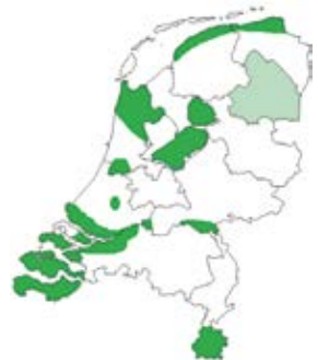
Gebieden in Nederland waar de Steriele Insecten Techniek wordt toegepast als bestrijding tegen de uivlieg.

Van Seminis zijn de nieuwere rassen de SV 3557 en de Rockito . De Rockito heeft gemiddelde cijfers qua productiviteit maar blinkt positief uit in bewaarkwaliteit. Het vroegheidscijfer is een 7,6.