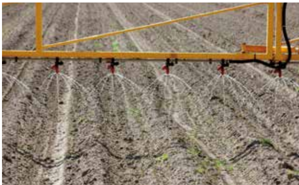
Toediening N-xt Calcium met de veldspuit na het poten en voor het frezen van de aardappelruggen.

N-xt bodemmeststoffen kunnen tijdens het poten worden toegepast. Dit kan echter ook daarvoor of daarna. N-xt bodemmeststoffen dienen bij aardappelen bij voorkeur vlak naast of onder (zo'n 5-10 cm) de knol te worden gedoseerd. Bijvoorbeeld via een meskouder op de pootmachine. Ook kan het bij het poten aan een chemische bestrijding worden toegevoegd of worden gemengd met andere vloeibare bodemmeststoffen van N-xt Fertilizers.